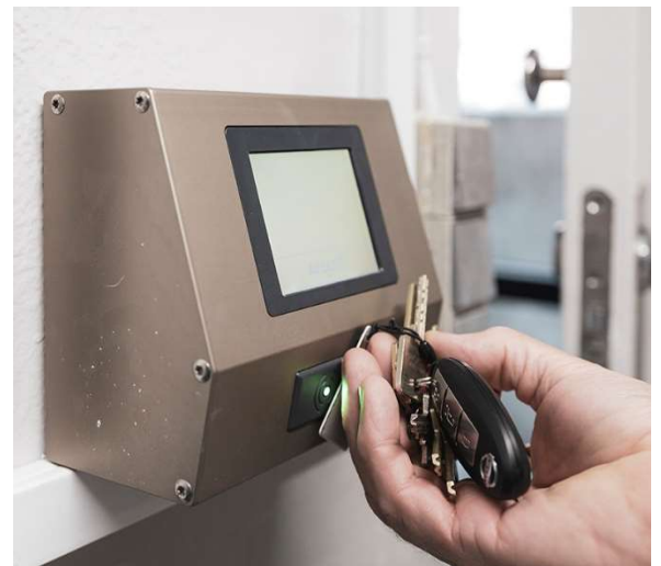
Med en chip logger beboerne sig ind på den tid, de har reserveret.