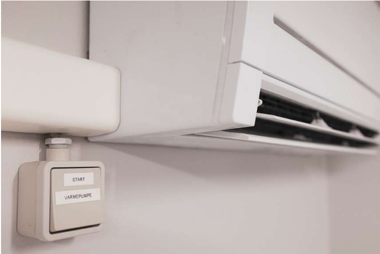
Med et enkelt klik på en knap sætter beboeren systemet med varmepumper og affugter i gang.

De to vaskerum har både en varmepumpe og en affugter, og virker lidt som en tørretumbler. I loftet hænger solide jernrør, som beboerne kan hænge deres tæpper over, når de er færdige med at blive vasket og klar til at blive tørret.